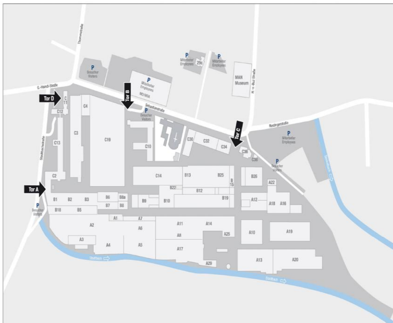
Werkspan Augsburg Factory Map Augsburg

Tor A: Stadtbach Tor Tor B: Sebastian Tor Tor C: Buz Tor Tor D: Diesel Tower